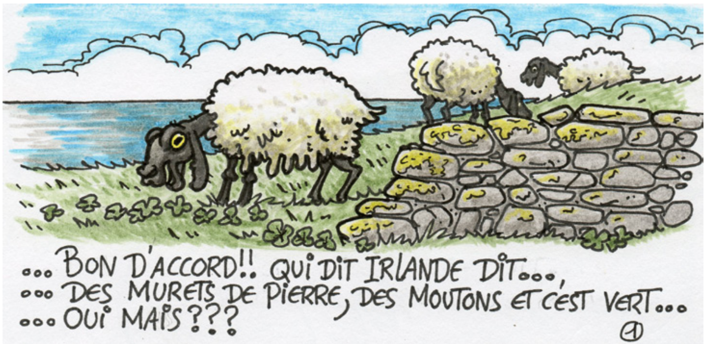
Dessin : Yann Couvin