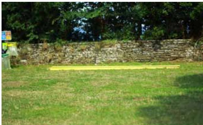
Dernière photo en date de la discrète équipe de la Volante.

Nous en cherchons encore la signification.