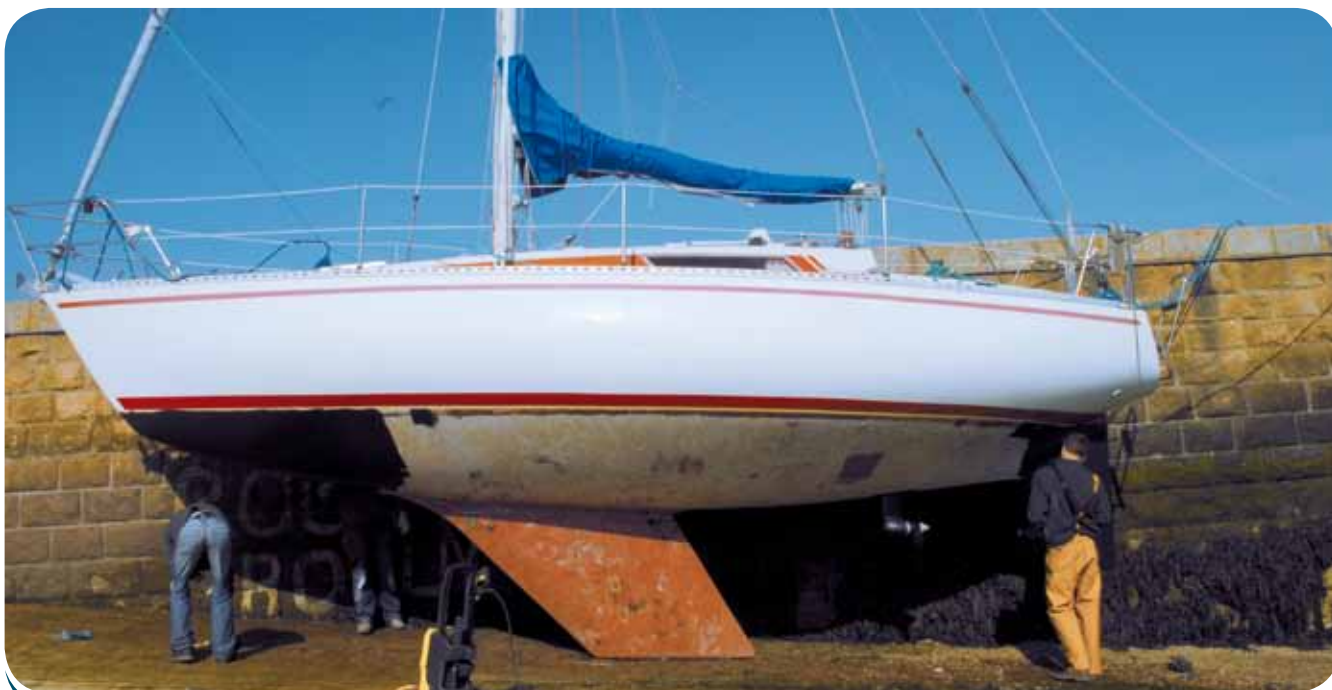
« Soft Sun », le First 30 du CNG, caréné par son jeune équipage

C'est en juillet 2008 qu'une 1 ère réunion impromptue réunissait à « L'Escale » une vingtaine de plaisanciers de Port Tudy dans le but de se rassembler en association. Or il se trouvait que le vénérable Club Nautique de Groix, bien que fier de son passé d'école de voile, était en sommeil depuis quelque temps déjà et se trouvait en instance de dissolution. Aussi, plutôt que de monter de toutes pièces une nouvelle entité, la décision était prise de relancer ce vieux CNG et d'en faire l'association des plaisanciers de Port Tudy.